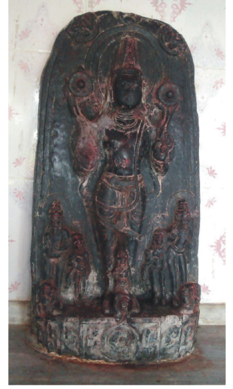
बनकट्टा की दो सूर्यमूर्तियाँ

भगवतीपुर बाजार दो मूर्ति (मधुबनी), परसा (मधुबनी), पोखराम (दरभंगा), पटोरी (सहरसा), पोझियाम (वैशाली), रघेईपुरा (दरभंगा), रोहार महमूदा खण्डित प्रतिमा (दरभंगा), रखवारी जली हुई प्रतिमा (मधुबनी), रतनपुर (दरभंगा), राजनगर (मधुबनी), सवास (दरभंगा-मुजफ्फरपुर सीमा), सलेमपुर (मधुबनी), श्रीनगर (धौलाढ़, मधेपुरा), सीताकुंड (पिपरा, पूर्वी चम्पारण), दैपुरा (देवपुरा, बेनीपट्टी, मधुबनी), लालगंज (क्योटी, दरभंगा), नदियामि (दरभंगा), सिपहगिरी (मधुबनी) आदि जगह हैं। क्षेत्रों में मंदिरों में रखी हुई प्रतिमाओं से अलग