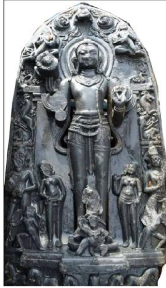
सूर्य-मूर्ति, घनश्यामपुर, दरभंगा