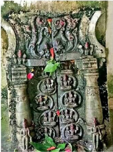
द्वादशादित्य, शिवनगर, मधुबनी