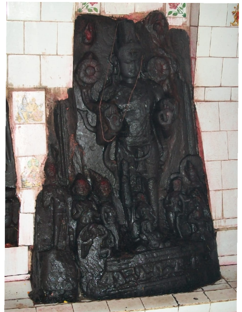
सूर्य-मूर्ति, भोज पंडौल, मधुबनी