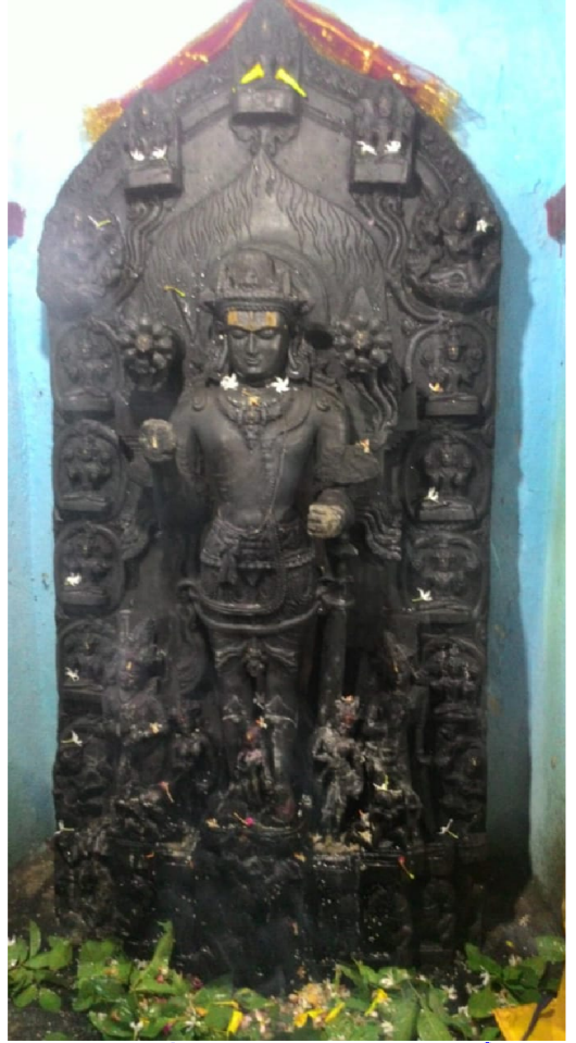
द्वादशादित्य, बरुआर, मधुबनी

सूर्य को 'द्वादश आदित्य' के रूप में पूजने की प्राचीन परम्परा रही है। मधुबनी जिला के बरुआर में द्वादश आदित्य की बहुत अच्छी प्रतिमा है। महाकाव्यों और पौराणिक कथाओं में द्वादश आदित्य के रूप में धातु, मित्र, अर्यमन, वरुण, रुद्र, सूर्य, भग, विवस्वान्, पूषन, सविता, त्वष्टा और विष्णु के नाम मिलते हैं। आदित्यों के नाम की सूची में सभी शास्त्रों में अलग अलग मिलती है। सूर्य के बारह स्वरूपों की कल्पना उनके कार्यों के आधार पर किया गया है। विष्णुपुराण