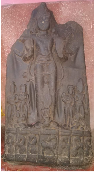
सूर्य-मूर्ति, हाबीडीह, दरभंगा