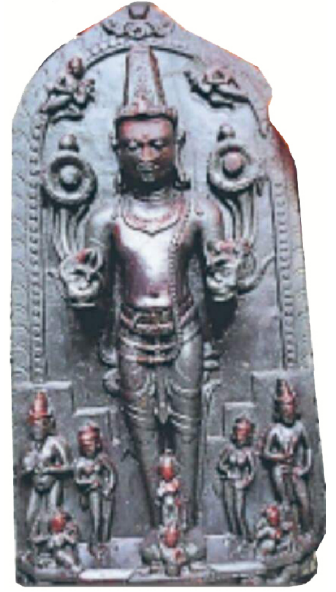
सूर्य-मूर्ति, सत्तरकटैया, पतोरी, सहरसा